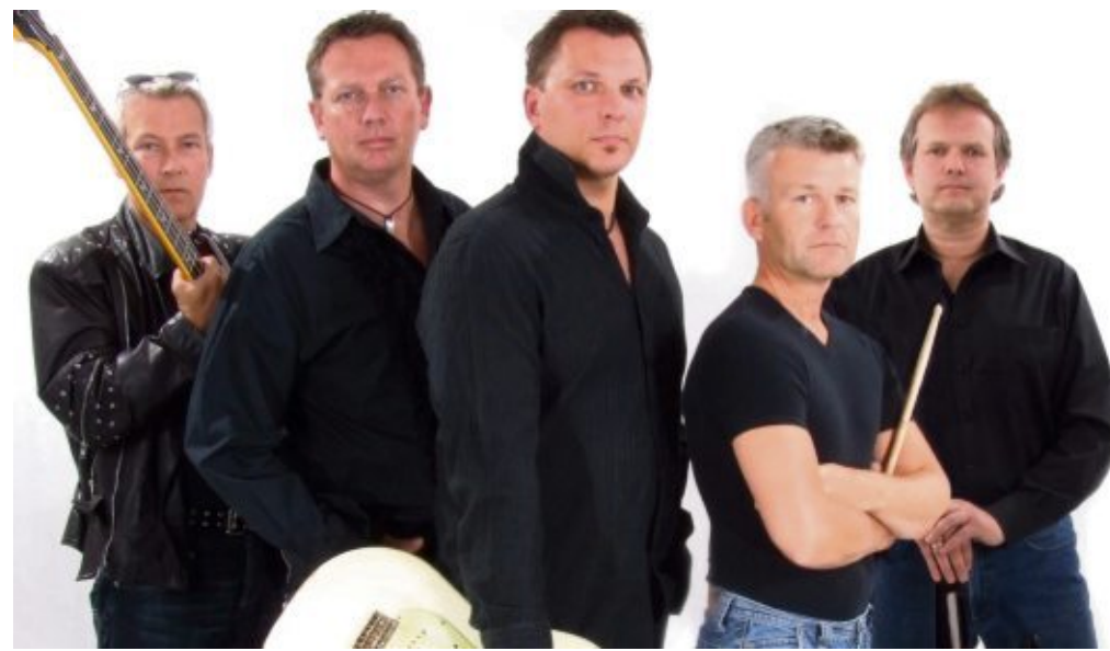
Die Band Free Company eröffnet den Musiksommer im Schaufenster Fischereihafen.